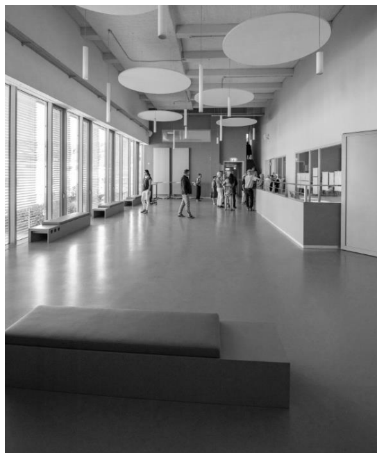
Foyer 1. Stock